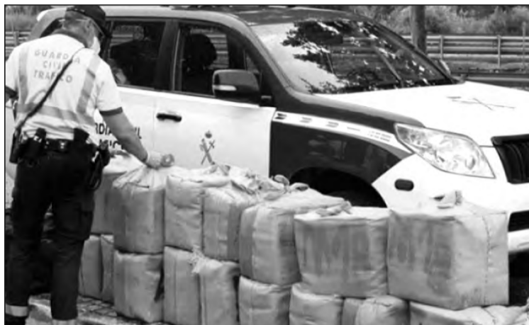
Cette intervention a abouti à la confiscation de 121 ballots, soit un

Après avoir étudié son itinéraire et sa direction, la Garde civile a mobilisé les moyens de ses services maritime et aérien, pendant que ses unités terrestres demeuraient en place pour surveiller les points possibles de débarquement sur le littoral.