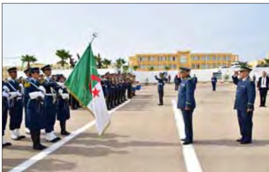
d'esprit de responsabilité et d'amour de la patrie, les appelant à déployer tous leurs efforts dans l'accomplissement de leurs nobles missions pour défendre l'intégrité de la nation

Il a également exhorté les diplômés à faire preuve du plus haut degré de discipline,