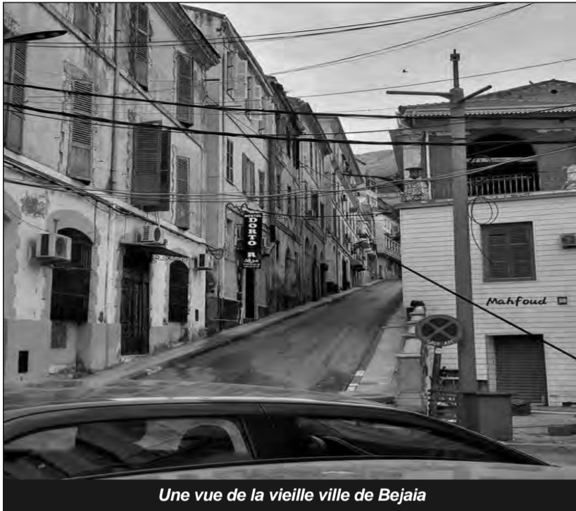
Une vue de la vieille ville de Béjaïa