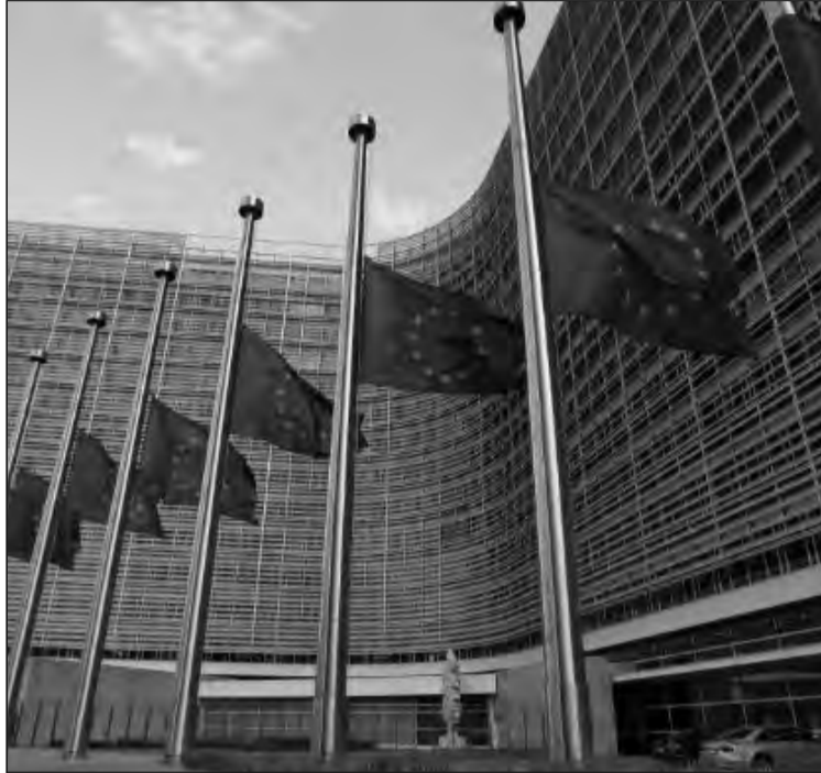
Les signataires estiment que « l'UE doit au minimum imposer des sanctions ciblées, notamment des interdictions d'exercer des activités commerciales et des interdictions de visa dans l'UE, visant

« L'Union européenne et les États membres doivent agir dès maintenant, notamment lors du Conseil des affaires étrangères du 11 mai », ajoutent-ils.