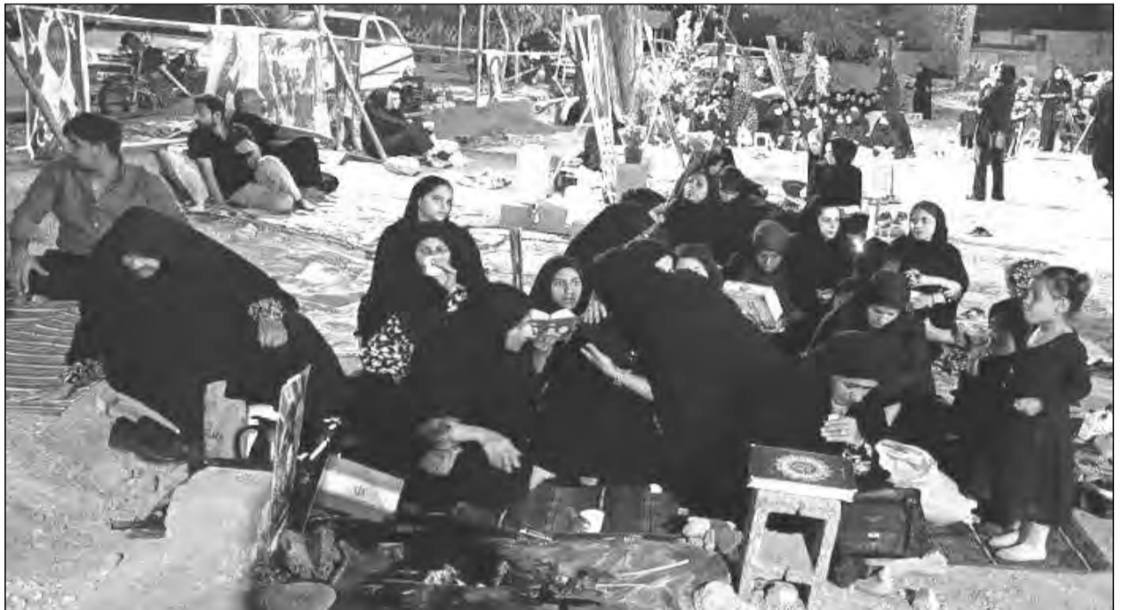
15 mars 2026 – En Iran, des familles passent les soirs du ramadan sur les tombes des enfants tués à l'école primaire Shajareh Tayyiba le 28 février.

Quant à la société Palantir, elle dégage aujourd'hui des milliards de dol-