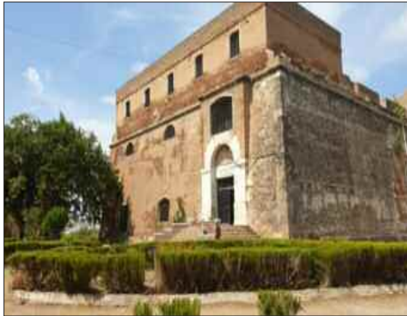
Bab El Bounoud), la Porte Sarrazine, le Fort de Gouraya, Bordj Moussa, ainsi que le plan de sauvegarde de la vieille ville. Il a ajouté que des infrastructures culturelles comme le théâtre régional "Abdelmalek Bouguerrouh", la

M. Reghal a précisé que ces interventions ont visé plusieurs lieux emblématiques : la citadelle de la Casbah, Bab El Fouka (aussi nommé