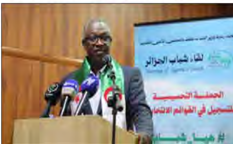
qu'ils s'impliquent fortement dans la vie politique, en tant que catégorie sociale bénéficiant d'une attention particulière de la part du président

Dans une allocution, le ministre a affirmé que "l'Etat œuvre à encourager et à soutenir les jeunes afin