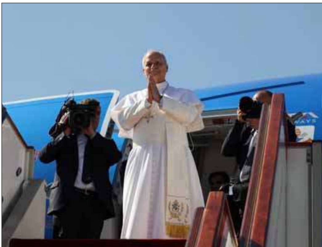
LE PAPE LÉON XIV