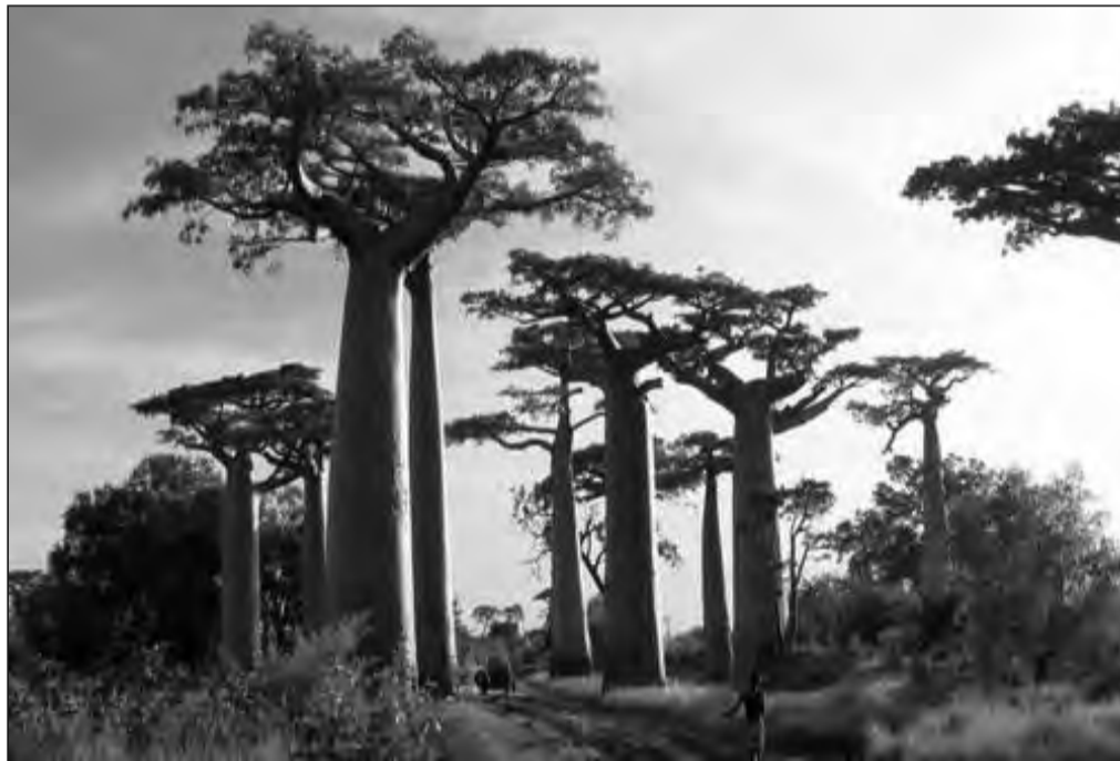
de l'insecte vers le continent africain.

Madagascar abrite six des huit espèces de baobabs connues dans le monde, dont certaines – comme Adansoniaperrieri – sont classées « en danger critique d'extinction » par l'UICN. La menace y est donc latente. Les chercheurs redoutent que le commerce international – transport de bois non traité ou de plantes ornementales – ne facilite la dispersion