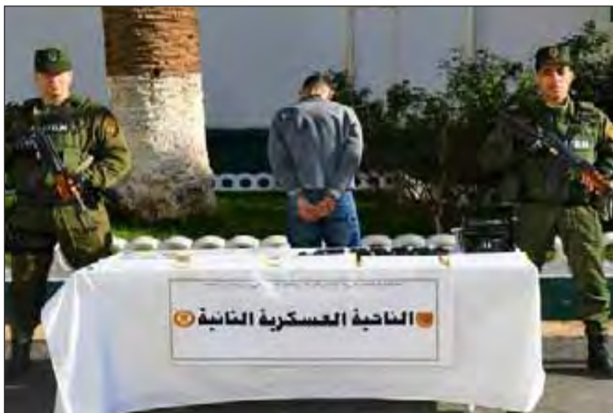
ment de la Gendarmerie nationale en tirant sur le véhicule et en éliminant les deux criminels qui se trouvaient à bord qui tentaient d'exfiltrer le baron", ajoute le

A l'issue, "ce baron a tenté de s'enfuir à bord d'un véhicule de type Renault-25 avec deux criminels, ce qui a conduit à l'intervention du personnel du détache-