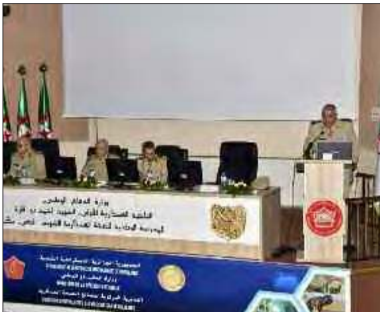
une meilleure prise en charge et en se concentrant sur les programmes de rééducation visant à restaurer et renforcer l'indépendance fonction-

Ce séminaire vise "à discuter des questions liées aux différents aspects de la prise en charge des blessés de guerre, depuis le champ d'opérations jusqu'à leur réintégration, afin d'améliorer leurs conditions de vie sociale et professionnelle, en mettant en évidence le rôle des différents services de santé militaire dans l'accompagnement des blessés de guerre à leur réintégration, en améliorant la coordination multidisciplinaire pour