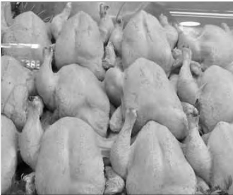
lement d'un stock de sécurité d'environ 410 tonnes de poulet de chair. Pendant cette conférence de presse, le directeur local du Commerce et de

Ces points de vente sont répartis dans les 12 daïras de la wilaya. Elle a assuré que Carravic dispose actuel-